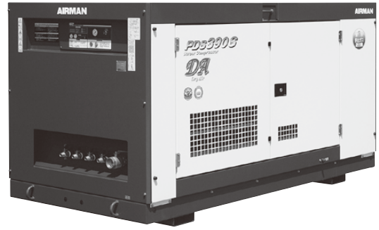
100HP エンジンコンプレッサー