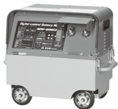
バッテリー溶接機