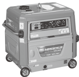
小型エンジンウエルダ