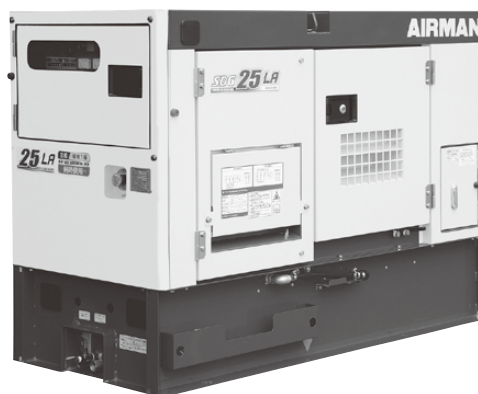
25KVA 発電機マルチビッグタンク

三相4線式・単相3線式を同時出力します。三相の発電機と単相の発電機を別々に用意したり、切替作業をしなくても、発電機1台で幅広い用途にお使いいただけます。