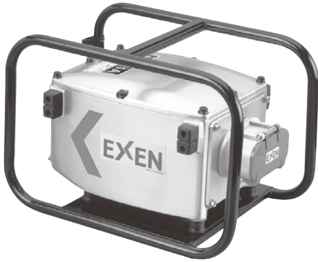
マイクロインバーター