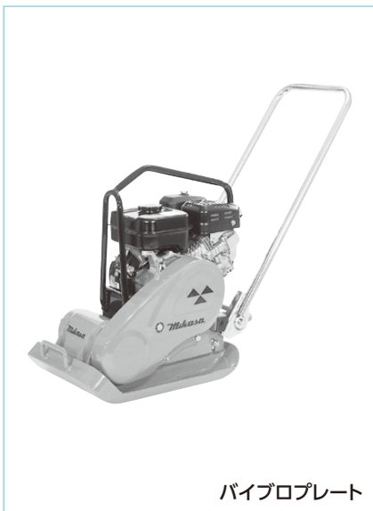
バイブロプレート